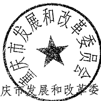
重庆市发展和改革委员会