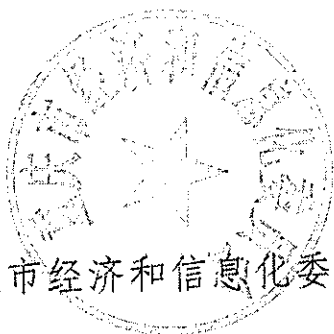
重庆市经济和信息化委员会

要求，结合我市实际，现将制定的《重庆市深化用户用气报装改革优化营商环境的实施方案（试行）》印发给你们，请认真贯彻落实执行。