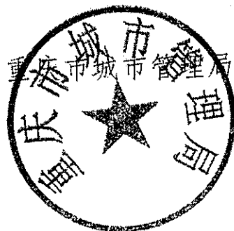
重庆市城市管理局