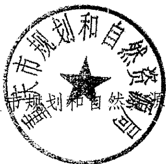
重庆市规划和自然资源局