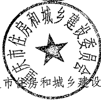
重庆市住房和城乡建设委员会