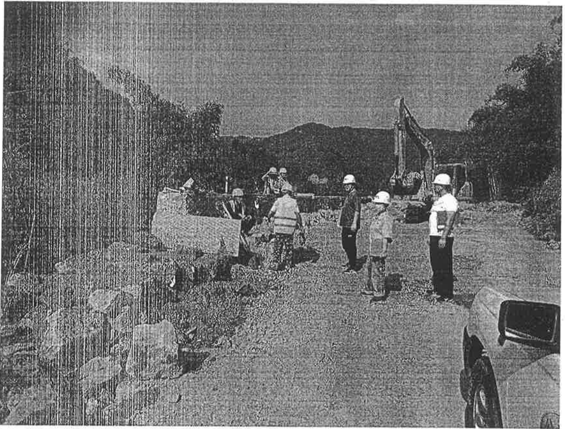
应急办邓主任带队检查兴隆 G351 改建沿线施工安全